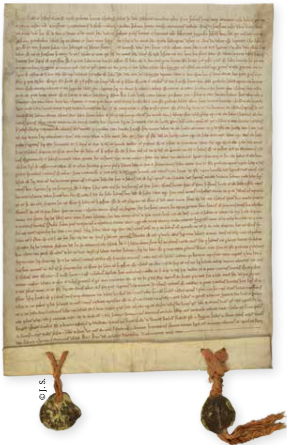
La charte de 1235, document majeur de l'histoire de Lille, est conservée aux Archives municipales.

La charte interdit aux membres d'une même famille de figurer dans l'échevinage et ils ne peuvent se porter à nouveau candidats qu'après un délai de trois ans. Cela n'empêche pas l'installation d'une certaine oligarchie. Néanmoins, ces règles permettent une rotation plus rapide des familles et empêche les plus riches d'accaparer tous les pouvoirs.