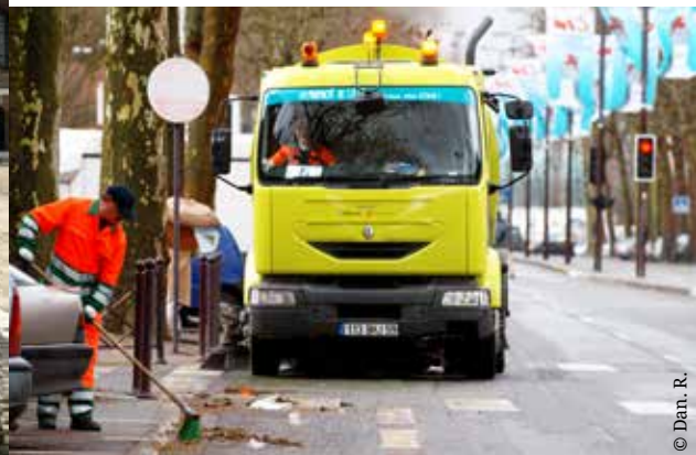
Propreté : ensemble, c'est enfantin P16