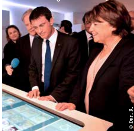
Manuel Valls a visité la « Smart home » d'EuraTechnologies.

En visite à Lille le 18 mars, le Premier ministre Manuel Valls a annoncé l'arrivée dans la métropole d'un nouveau pôle de recherche technologique. Le CEA Tech est une Filiale du Commissariat à l'énergie atomique. Sa mission ? Développer des technologies au service de l'industrie en créant des ponts entre le monde économique et le secteur scientifique et universitaire. Le CEA Tech, attendu à EuraTech dès septembre, doit accélérer la recherche et développement des différents secteurs régionaux en pointe. Cela concernera « le numérique, l'énergie, la