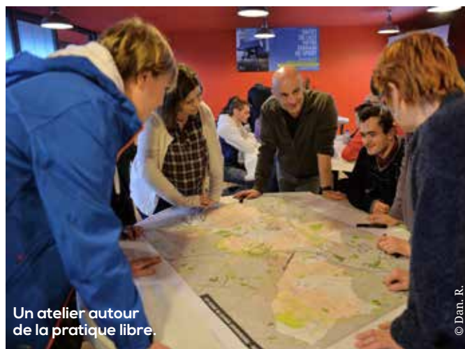
Un atelier autour de la pratique libre.

ger sur vos pratiques et de proposer vos idées pour faire de Lille votre terrain de sport. Des urnes ont aussi été déposées dans les grands équipements sportifs de la ville. Vous y retrouverez l'ensemble des rendez-vous mais aussi un questionnaire. Il est bâti autour de deux grandes questions : êtes-vous satisfait des offres sportives à Lille ? Quelles sont vos suggestions pour faire « bouger » le sport à Lille ? Enfin, il vous reste aussi le site web de la Ville. Alors, faites-nous part de vos suggestions pour faire de Lille votre terrain de sport ! ● Par Fred VDB Retrouvez le programme sur sport.lille.fr