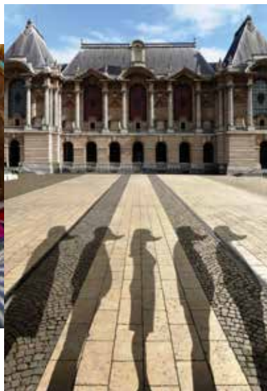
Portrait : Le collectif interDuck P14