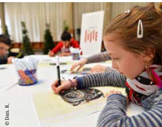
Grand angle : La propreté au bout des doigts P06