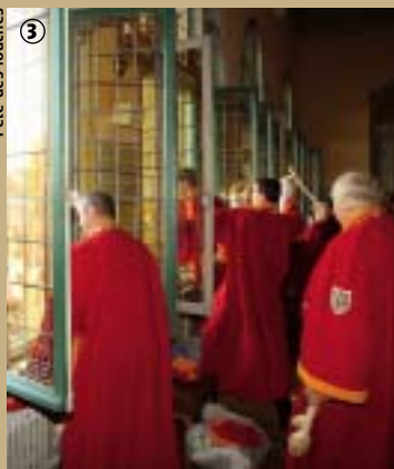
Fête des louches

Aujourd'hui, témoins de l'histoire de Comines et somptueusement décorés, les chars traversent majestueusement la ville. Le plus attendu est le dernier, celui de la confrérie des Louches qui, elle