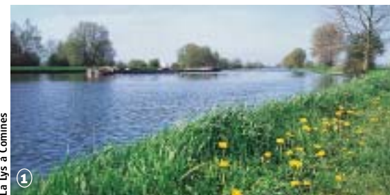
La lys à Comines