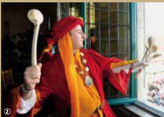
Fête des louches

Du haut des beffrois du Nord, on jette de tout... et même des louches ! En bas, sur la place de l'hôtel de ville, des foules en liesse se pressent et se bousculent pour attraper le précieux trésor... Ils sont fous ces Nordistes !